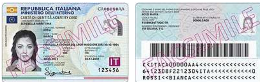
La Carta di identità elettronica - Ministero dell'interno* , cartaidentita.interno.gov.it .

Ai cittadini che usufruiranno di tale servizio verranno fornite tutte le informazioni sui servizi accessibili tramite CieID .