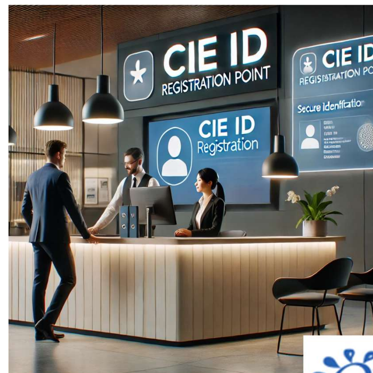
* Immagine generata con Intelligenza Artificiale (AI)